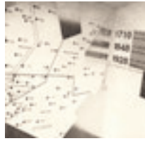
Pressa, tif + 2.tif 1928