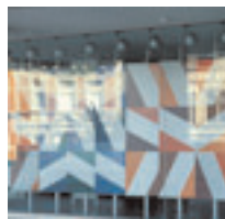
Stankogramme 2x (Stadthaus Bonn) 1973/77