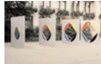
Baden-Baden, Freiplastik 1981