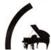
Entwurf für ein Musikzimmer, 1928