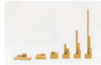
Gleiche Volumen 1979