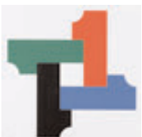
Stadthaus Bonn Etagenzahlen 1, 3, 5, 10, 1973/77 (02.tif, 05.tif, 09.tif, 20.tif)