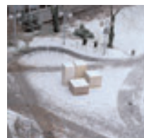
Landratsamt Esslingen, Freiplastik 1992