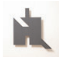
Eigenform, 3 Stück, 1988