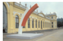
Ausstellung Kassel, Orangerie (Plastik, zweischalig) 1986