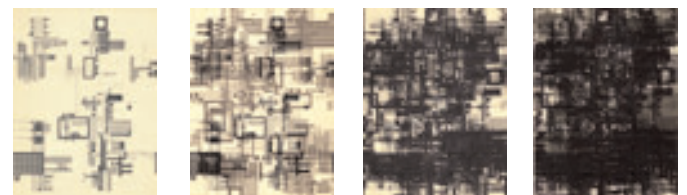
Reihenbild, 1959 These von ungesteuertem Wachstum, das zur Bedrohung führt.