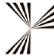
Schutzmarke SEL, 1954 Die ganze Nachrichtentechnik, sinnfälliger Hinweis auf die Funktion „Rundfunk“, von Senden und Empfangen.