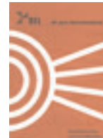
Broschürentitel Firma SEL, 1961 Die ganze Nachrichtentechnik, Wellen und Strahlen