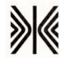
Schutzmarke, 1954 Süddeutscher Rundfunk