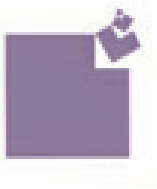
Neujahrskarte, 1976 Zeit ist messbar, beispielsweise das Jahr als flächige Größeneinteilung von Jahr, Monat, Woche und Tag.