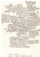
Neujahrskarte 1961 Unsere Zeitrechnung durch Striche dargestellt.