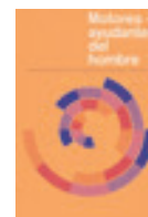
Ausstellungsplakat Institut für Auslandsbeziehungen, Stuttgart 1957