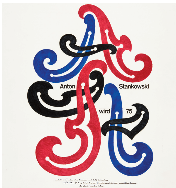
Hermann Eidenbenz Anton Stankowski wird 75 Filzstift auf Papier, 1981