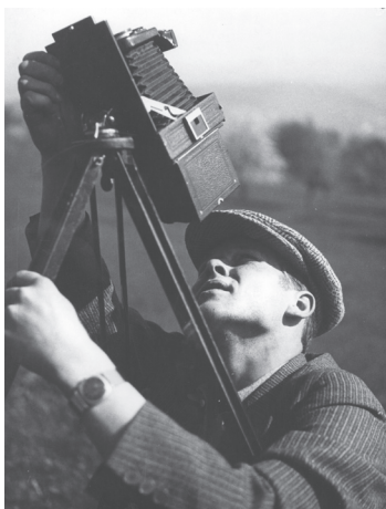
Anton Stankowski Eidenbenz mit Kamera schwarzweiß Fotografie, 1935