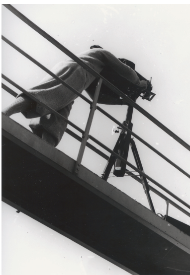
Anton Stankowski Der Fotograf schwarzweiß Fotografie, 1930er Jahre