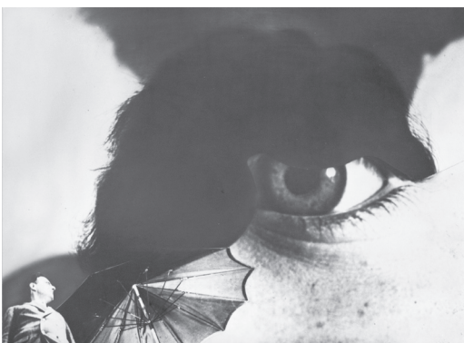
Anton Stankowski Fotografie „Hommage an Prof. Burchartz“ 1927