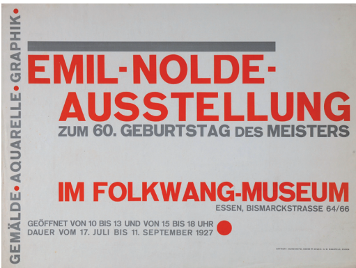
Max Burchartz, Plakat 1927