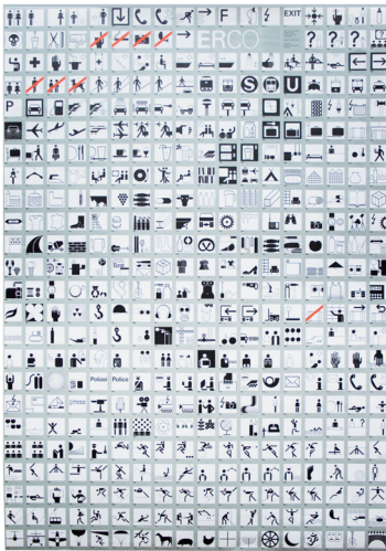
Otl Aicher Plakat Pictogramme für ERCO 1976

Studium an der Akademie der Bildenden Künste München. Eigenes Atelier in Ulm ab 1947, Heirat mit Inge Scholl, Schwester von Hans und Sophie Scholl. Mitbegründer der „hfg“, Hochschule für Gestaltung Ulm und Dozent für visuelle Kommunikation. Er war Gestaltungsbeauftragter der Olympischen Spiele von München, 1972, Anton Stankowski hatte die Funktion des Vorsitzenden des Ausschusses für visuelle Gestaltung. Aicher gilt als Wegbereiter des Corporate Designs mit Arbeiten für die Lufthansa, ZDF, ERCO, Flughafen Frankfurt etc.