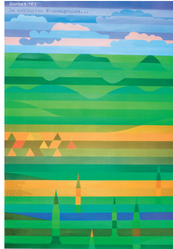
Otl Aicher Plakat „Im schönsten Wiesengrunde...“ 1983